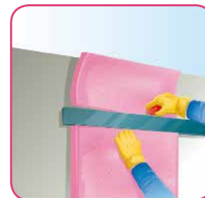
Corte el material excedente con una navaja o cuchillo con filo.