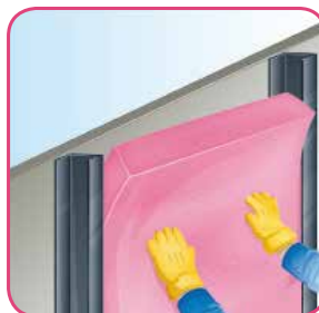
Presione hacia la cavidad.

Una vez que se fijan al muro o al techo las tiras de madera, el Aishlogar se coloca en los espacios libres entre bastidores. Tenga el cuidado de verificar que terminado de instalar el Aishlogar quede bien en contacto con el techo, el piso y los postes laterales. Encima de todo el conjunto y si la diferencia entre la temperatura exterior a interior llegara a ser muy alta (como en zonas de climas extremos), convendrá colocar una barrera de vapor (si el producto no cuenta con una). Esta barrera puede ser de Kraft Asfaltado. Posteriormente, y sobre la barrera de vapor, se procederá a colocar el tipo de acabado que se desee, pudiendo ser un lambrin de madera o un panel de yeso. En el caso del panel de yeso podrá adquirir papel tapiz o el acabado de su preferencia.