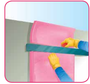
Corte el material excedente con una navaja o cuchillo con filo.