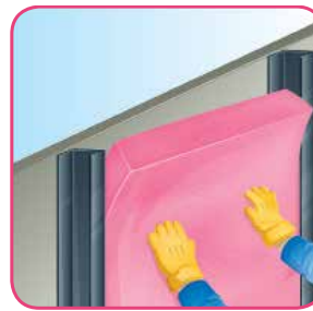
Presione hacia la cavidad.

En algunos pisos, como en los de duela o de madera, suele instalarse sobre el firme de concreto una estructura de madera con Aishogor de 7.6 cm (3") de espesor. Esto proporciona gran confort térmico y acústico en las habitaciones. Apropia para la capa doble.